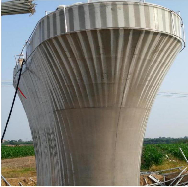
图 2 喷水孔间混凝土无法全湿润图