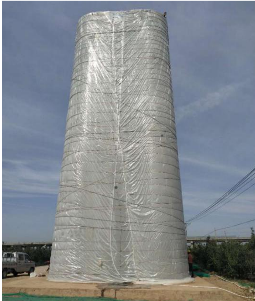
图 9 无塔供水养生均匀

针对人工控制养生造成养生不及时，不连续等问题，无塔供水系统通过时间继电器控制无塔供水器，设置控制喷淋时间和间隔时间，实现墩身定时喷淋养生。根据经验，季节和天气情况不同，喷淋时间和间隔时间不同，时间一般不超过 2 小时，选用 DH48S-S 型时间继电器（详见图 11），控制时间在 0~99min 内可调。