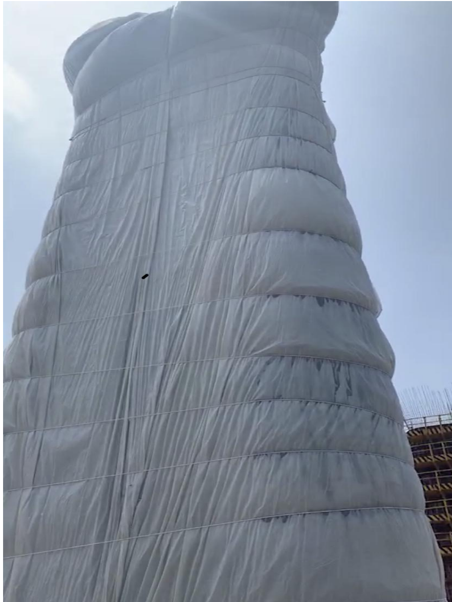
图 8 传统设备养生水压不足

水器组成。蓄水罐水源由水井直接供水，当蓄水箱水满之后水井水泵停止供水，蓄水罐水位低于 20cm 时，水泵自动工作，直至水箱水蓄满，整个工作一直循环，保证蓄水箱水满足养生需求。全自动无塔供水系统出水压力能达到 1.5Mpa，通过主管道供水，保证每个墩身养生时养生用水压力。