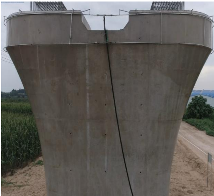
图 4 喷淋管道直径、喷水孔间距和孔径改进后养生效果

针对因喷淋管道外径较小、喷淋管道距混凝土表面距离、喷水孔间距及喷水孔孔径较大无法保障墩身混凝土全部湿润现象，通过反复试验，喷淋管道距混凝土表面距离宜控制在 10 cm，喷淋管道宜采用直径 20~30mm 管材，喷淋管道喷水孔间距宜控制在 10cm，喷水孔孔径宜为 0.5mm。