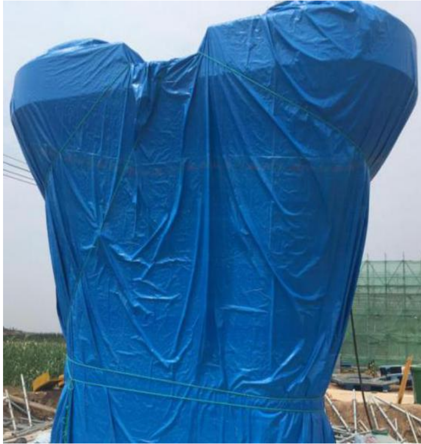
图 1 蓝色防水布养生衣

针对养生衣不透明造成无法查看墩身混凝土养生效果，对养生衣材质进行了改进，采用透明塑料布作为养生衣，可方便查看墩身混凝土养生效果，通过查看，因喷淋管道外径较小、喷淋管道距混凝土表面距离和喷水孔孔径较大，造成远离供水管道侧喷水孔喷出的水柱无法喷洒至混凝土表面，距离供水管道较近侧喷水孔因间距较大，造成喷水孔之间墩身混凝土无养生水，墩身混凝土养生无法全湿润，混凝土养生质量得不到保障。