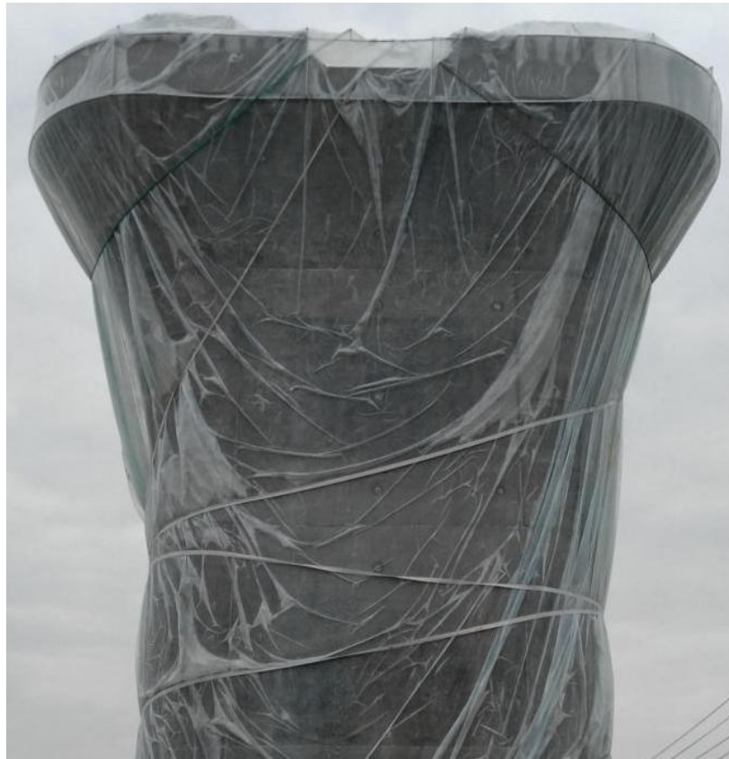
图 3 透明塑料布养生衣方便查看养生效果