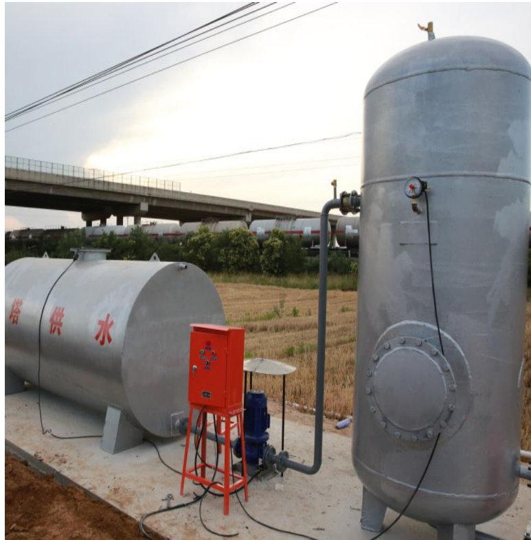
图 10 无塔供水系统