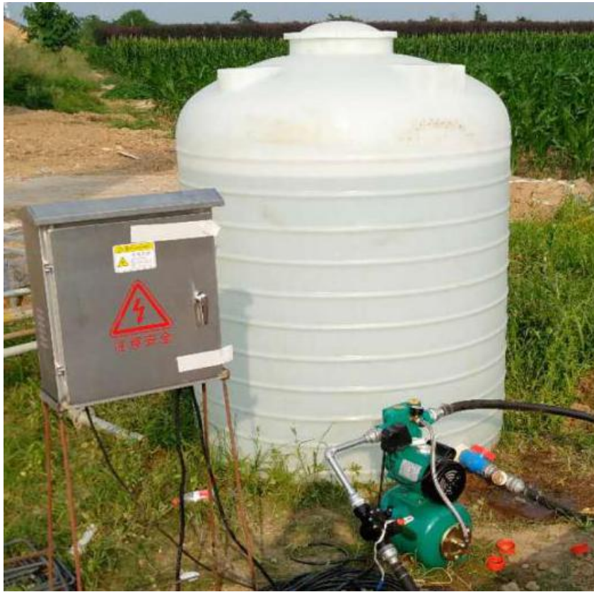
图 5 采用 2m 3 蓄水桶，减少送水频次

在墩身喷淋养生过程中，因时间继电器设置的喷淋间隔时间和喷淋时长需根据外界温湿度进行实时调整，调整时需养生人员到达养生地点对时间继电器进行调整，时间继电器无法监测混凝土表面温湿度，无法根据外界温湿度与监测的混凝土表面温湿度对喷淋时间进行自动调节，标准起草组成员根据调研，在时间继电器上配置网络模块，网络模块内置 4G 网络，可与手机 APP 软件连通，实现养生人员远程控制喷淋时长和喷淋间隔时间，网络模块与温湿度传感器连接，可根据感应的混凝土表面温湿度与外界温湿度对喷淋用水量进行调节。