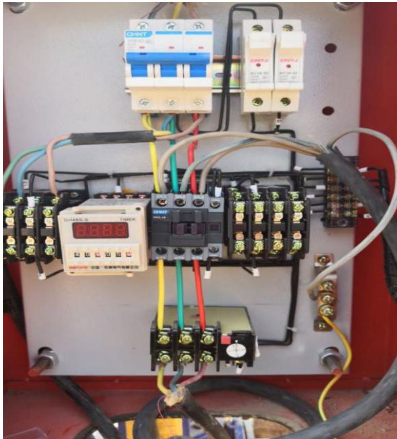
图 11 时间继电器控制柜