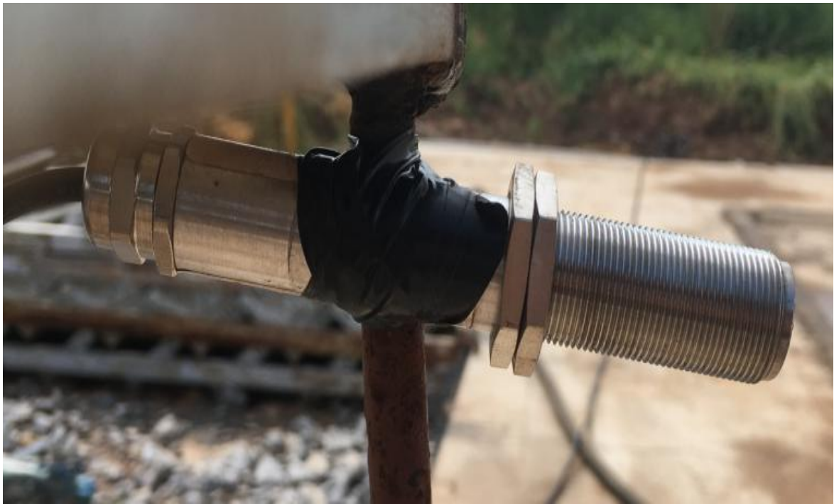
图 7 温湿度传感器

通过标准起草组成员对墩台混凝土喷淋系统不断试验和改进，智能喷淋养生系统可通过手机 APP 软件对每个墩台身养生设置喷